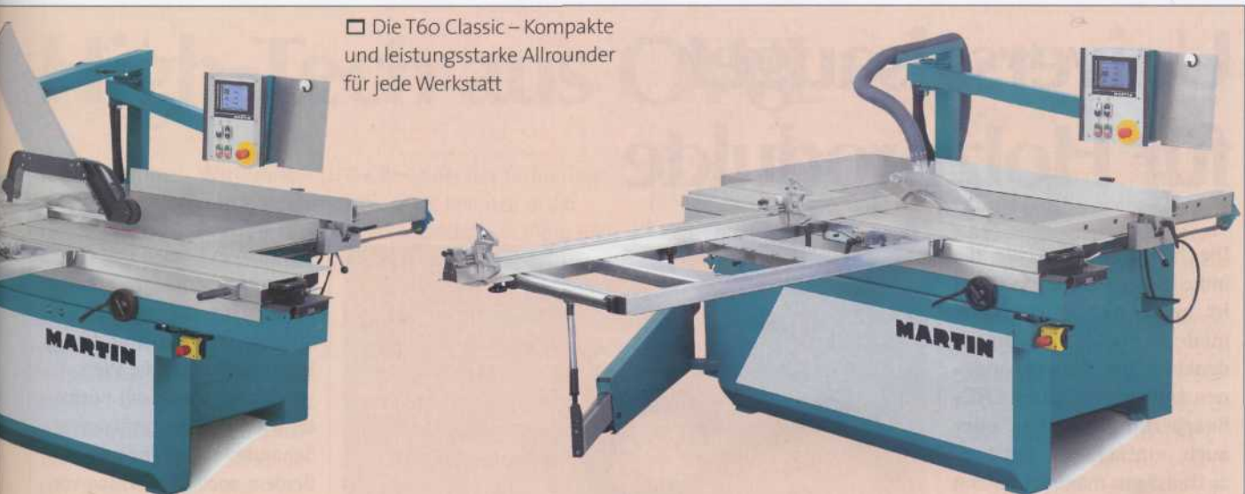
□ Die T60 Classic – Kompakte und leistungsstarke Allrounder für jede Werkstatt