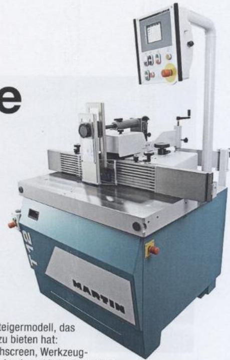
Einsteigermodell, das viel zu bieten hat: Touchscreen, Werkzeugdatenbank und hohe Laufruhe

Nähere Informationen und technische Daten zur T12 finden Sie auch in der aktuellen dds-Marktübersicht Tischfräsen für Einsteiger in dds Nr. 5, 2008, Seite 30/31.