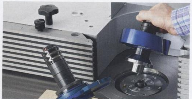
Wahlfreiheit: DornFix-Schnellwechsler oder HSK-Schnittstelle wie beim BAZ